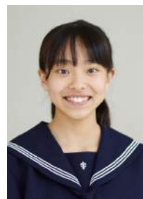
◎中1アドバンスコース

カナダのヴィクトリアで行われる海外研修。生徒たちは1人1家庭にホームステイをし、英語力向上に努めます。ヴィクトリア市長表敬訪問や、現地の学生との交流など、貴重な体験ができる2週間です。